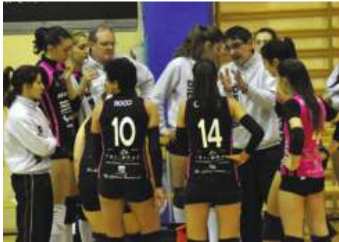
UN PRIMATO SOLITARIO CHE SPINGE A FARE ANCORA MEGLIO La SprintVirtus ha chiuso il 2016 davanti a tutte e punta a ripetersi nel 2017

po anche per il quinto e decisivo set. Le nerofucsia, però, sono ancora scosse dalla rimonta subita e finiscono subito sotto di quattro punti (5-1 e time-out Colombo) e arrivano al cambio campo sull'8-4. Nel momento più difficile, però, l'Abi ritrova la strada giusta e pareggia a quota 9. Da qui la partita diventa una battaglia. Le due squadre continuano a sfidarsi punto a punto, la gara arriva ai vantaggi, dove alla fine a spuntarla è la SprintVirtus (19-17).